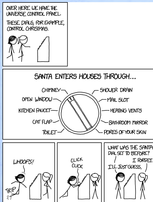
„Christmas Settings“ von xkcd.com

(Die Lösung gibt es in der nächsten Rohrpost!)