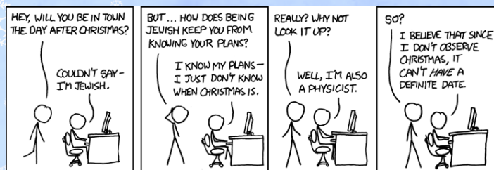
„Christmas Plans“ von xkcd.com

L IEBE Mathestudis, wir wünschen euch eine frohe Adventszeit, schöne Weihnachtsferien und eine erholsame Zeit zuhause. Zunächst freuen wir uns aber darauf, mit euch am 14. Dezember im legendären 5. Stock von Gebäude 48 unsere Fachschafts-Weihnachtsfeier zu begehen. Es wird gratis Glühwein, Punsch, Linsensuppe und Waffeln geben, außerdem wird musikalisch für Weihnachtsstimmung gesorgt. Kommt vorbei!